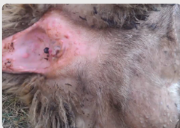
Rougeur et petits boutons à la base de la queue