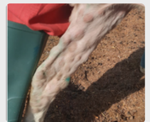
Boutons sur une patte